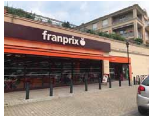
53 avenue Joffre 77450 ESBLY